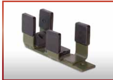
Schweizer Sturmgewehr 90 pkf-Nr. 510.282

Unser Programm ist so gestaltet, dass viele Auslegungen durch Anpassung vorhandener Elemente herstellbar sind. Für Haltersätze stehen Klemmlager und Verschlusslager zur Verfügung.