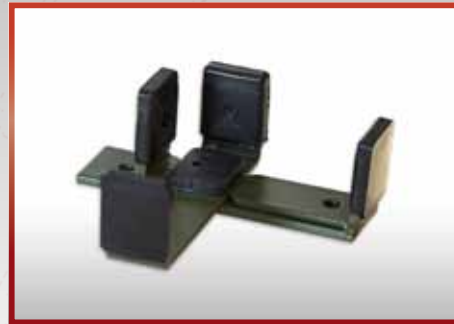
MG 4 Schulterstütze eingeklappt pkf-Nr. 510.262