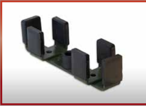
für G 36 , an Schulterstütze pkf-Nr. 500.105

Auch erforderliche Sonder - Elemente entstehen im eigenen Haus.