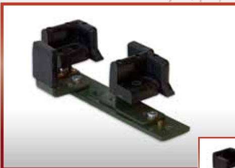
Verstellbare Aufnahme G 3 G 36 Schulterstütze aus- oder eingeklappt pkf-Nr. 500.108