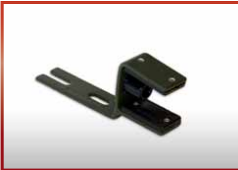
Wandaufnahme G 36 pkf-Nr. 500.109