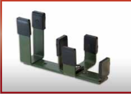
Gewehr AK 5 C pkf-Nr. 510.309