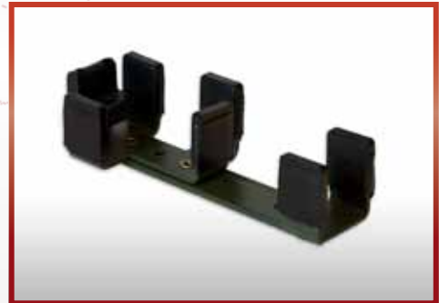
für G 36 , mit eingeklappter Schulter- stütze pkf-Nr. 500.106 B1