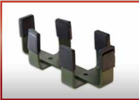
Gewehr Steyr AUG 77 pkf-Nr. 510.111