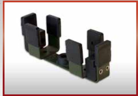
für G 3 und G 36 , an Schulterstütze pkf-Nr. 500.105 B1