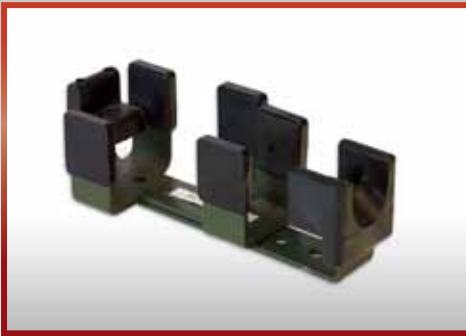
für G 36 , an Schulterstütze, und eingeklappter Schulterstütze pkf-Nr. 500.215