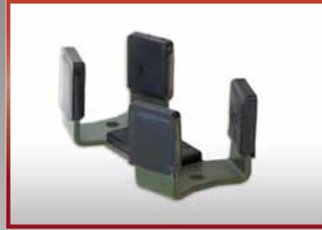
Gewehr HK 416 pkf-Nr. 510.304