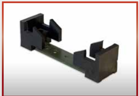
für G 3 , G 36 und Dimaco , an der Schulterstütze pkf-Nr. 500.185A