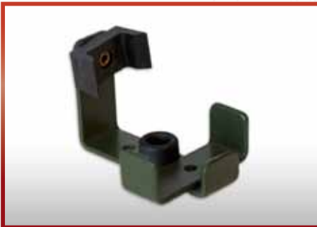
Kalaschnikov mit eingeklappter Schulterstütze pkf-Nr. 510.216